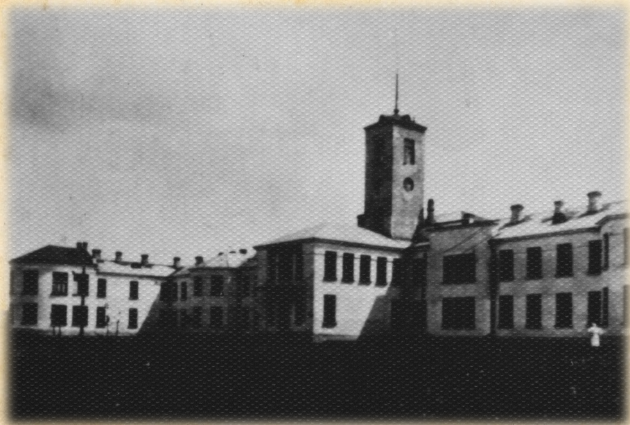
1935 г. Больница-медвуз