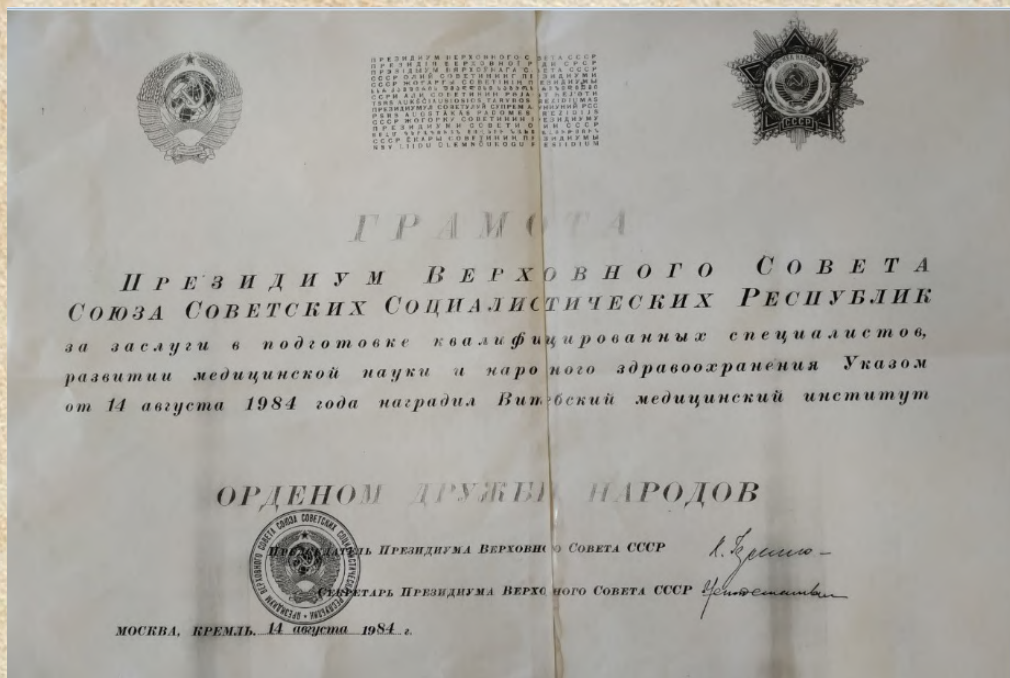
1984 г. Грамота Президиума Верховного Совета СССР о присвоении ордена Дружбы народов Витебскому государственному медицинскому институту.

В 1984 г. за большие заслуги в деле подготовки кадров для практического здравоохранения и развивающихся стран Африки, Азии и Латинской Америки и в связи с 50-летием институт был награжден орденом Дружбы народов.