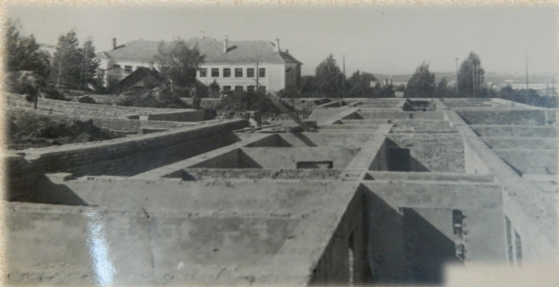
1957 г. Закладка фундамента теоретического корпуса на ул. Фрунзе, 27

В 1959 г. был построен новый теоретический корпус площадью в 9826 кв. метров