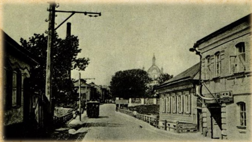
Здание бывшей казённой палаты по ул. Суворова, где располагались теоретические кафедры.

Для размещения клинических кафедр на ул. Задунавская (ныне – пр. Фрунзе) в 1935 г. была построена больница-медвуз.