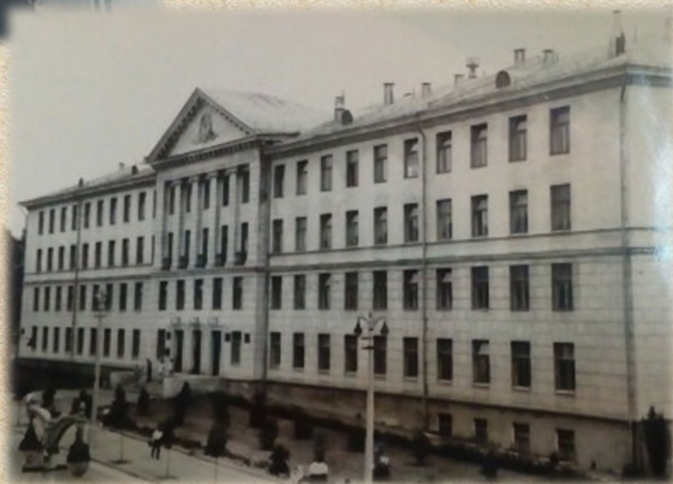
1959 г. Главный учебный корпус