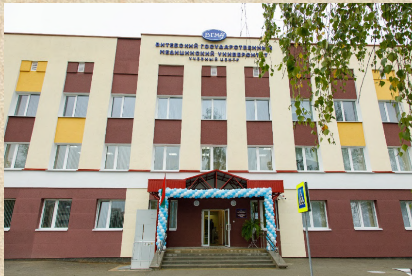
Учебный центр практической подготовки и симуляционного обучения