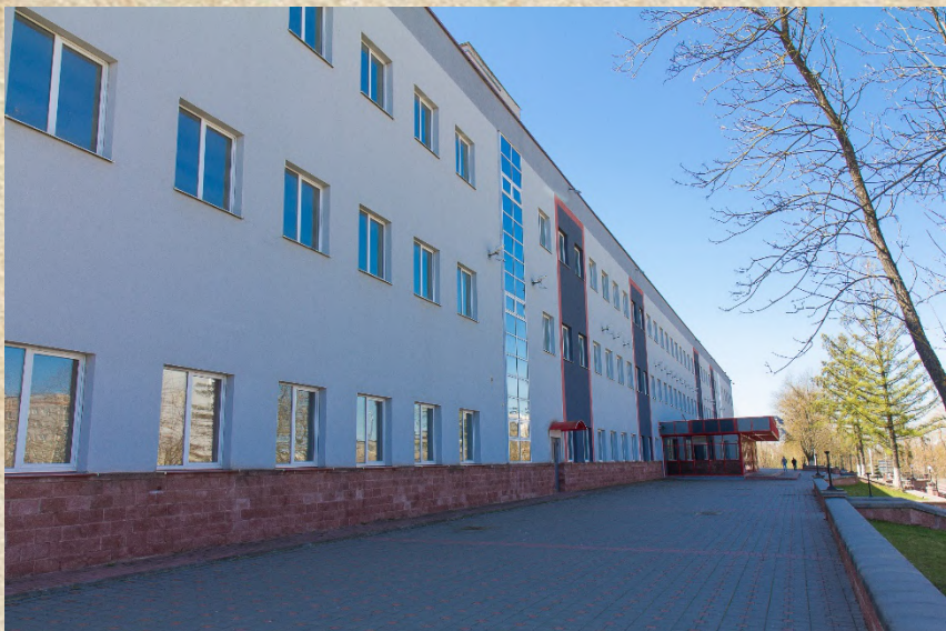
Центр экспериментальной медицины и фармации

С целью повышения качества и эффективности практико-ориентированной подготовки специалистов в университете создан Центры профессионального мастерства, экспериментальной медицины и фармации, практической подготовки и симуляционного обучения.