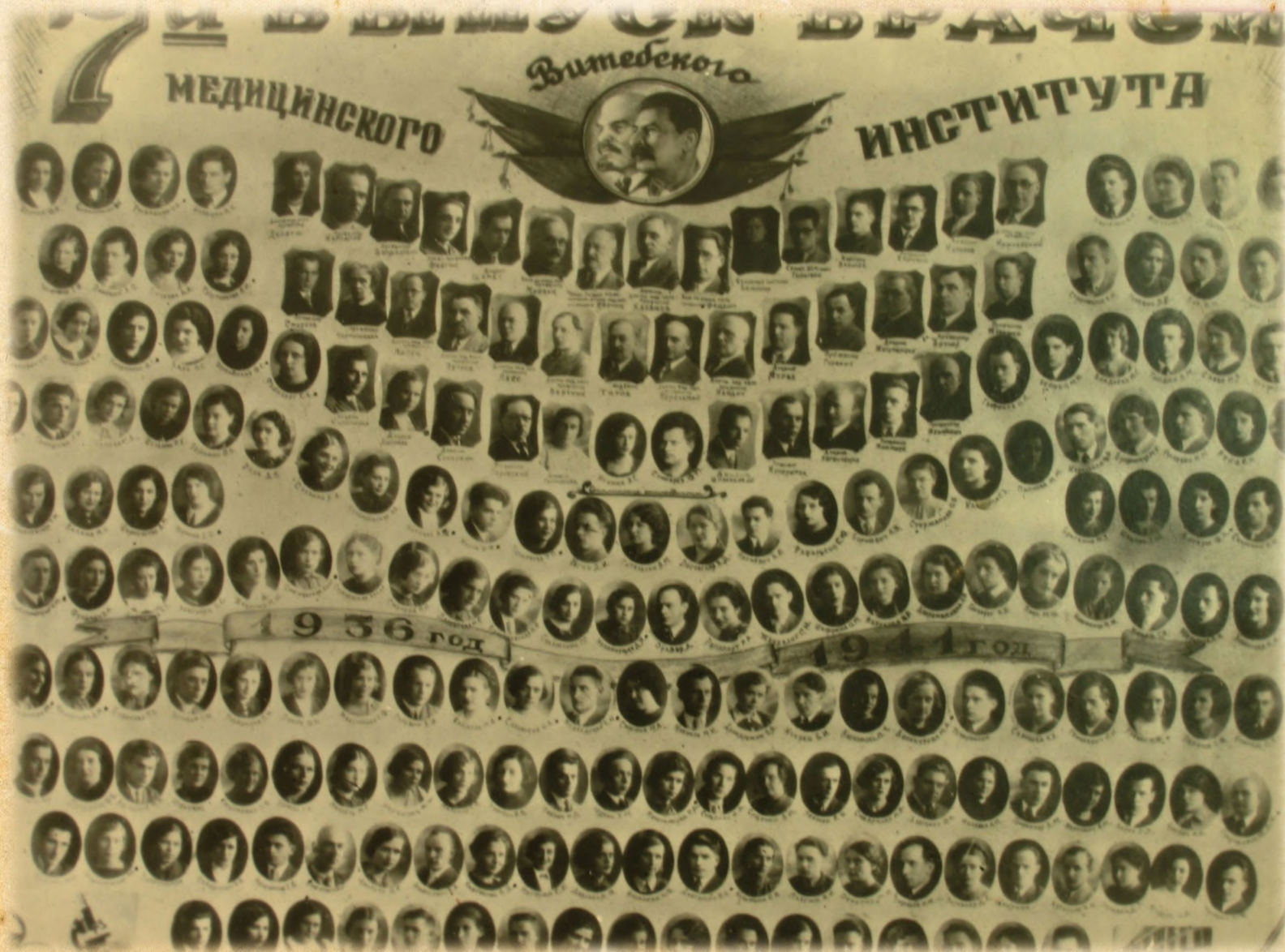
7-й выпуск врачей 1936-1941 гг. обучения

В конце июня 1941 г. институт провел седьмой выпуск врачей, насчитывавший 174 человека. Всего за довоенные годы было подготовлено и выпущено 808 врачей.