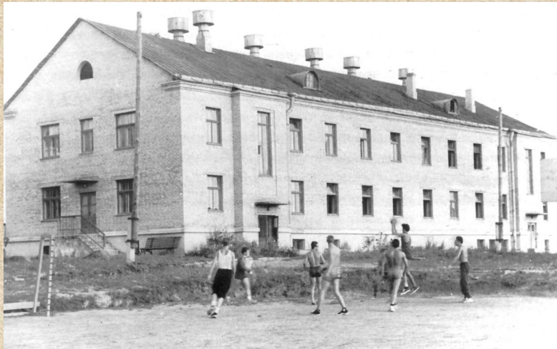
1963 г. Научно-исследовательская лаборатория